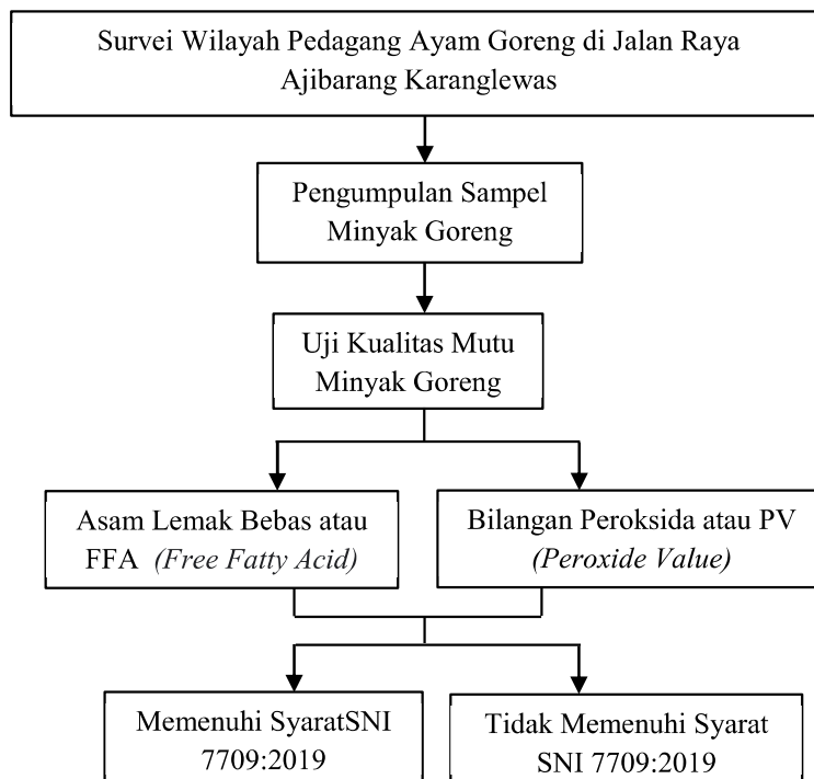
Gambar 2.1 Kerangka Konsep